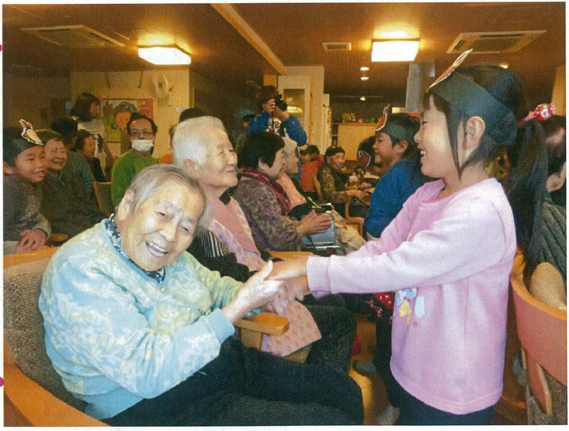
わかば保育園の園児との世代間交流