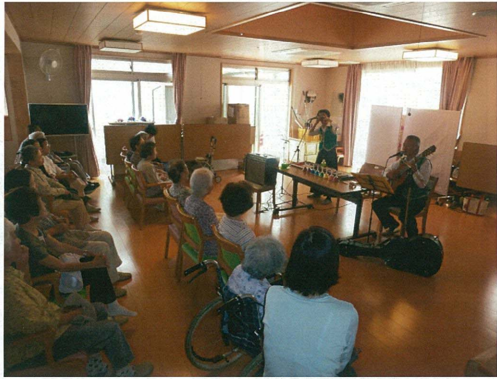
《オールディーズの演奏》

7月15日から9月30日までの毎週水曜日に「涼やかスポット」を実施しました。地域のご高齢の方々に来ていただき、涼んでいただくとともに、ご利用者、職員と交流を図りました。