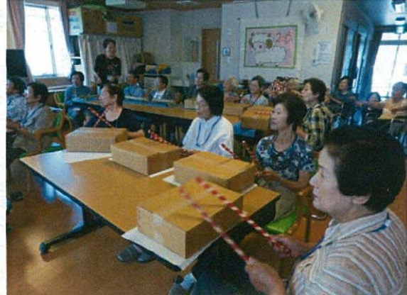
《福知山市認知症予防の会による「スリーAチャレンジ」》

本誌に掲載しております写真の使用に付いては、ご本人・ご家族の承諾を得ております。