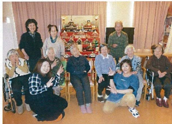
皆で 甘酒と雛あられを食べて 記念撮影♪

・石原地域いづみ会 ・福知山市認知症予防の会 ・さくら会 ・ロッシン2 御世話になりました。ありがとうございます。 また是非とも 宜しくお願いします。