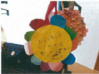
卒園児からプレゼント