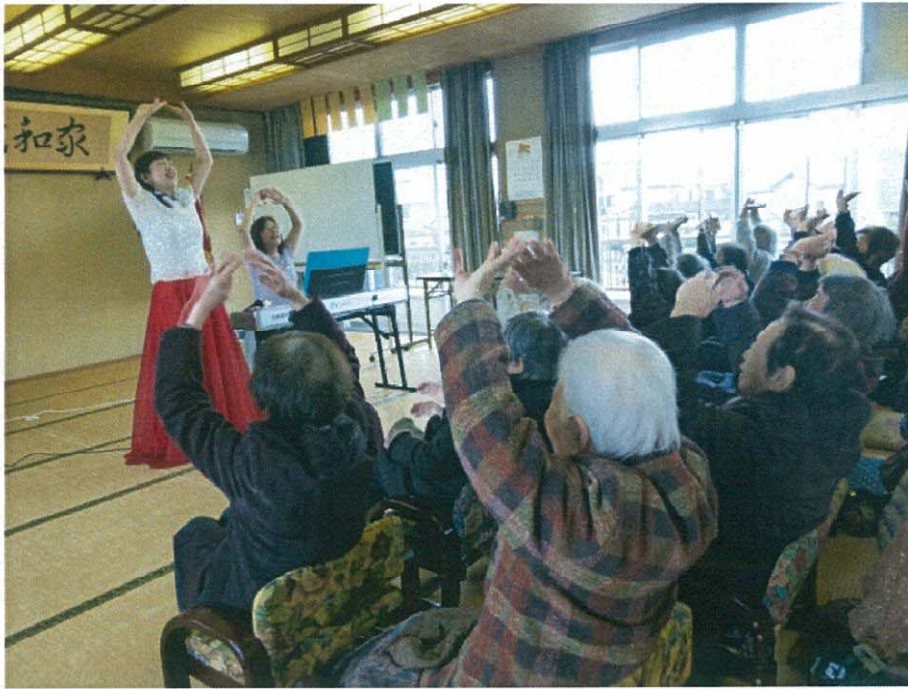
ボランティア団体「楽唄」による歌と演奏

2月24日、戸田会館（公民館）にて、地域民生委員様に協力を仰ぎ、戸田地域の「ふれあいサロン」を実施しました。