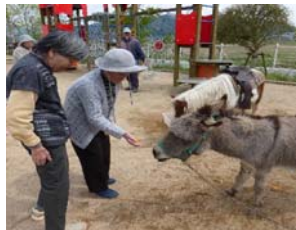
お馬さん？ほれほれ、こっちにおいで♪