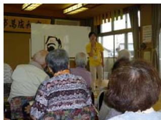
みんなで嚙下体操や勉強をしました。