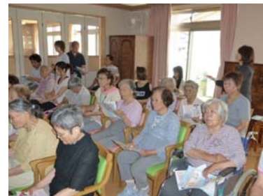
熱中症予防の勉強会

熱中症に関する注意事項・どの様に予防するか？ 講習を聞き、この夏の暑さを乗り切る準備が出来ました。