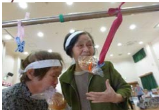
パン食い競争・・・誰が一番にパンが取れるかな♪