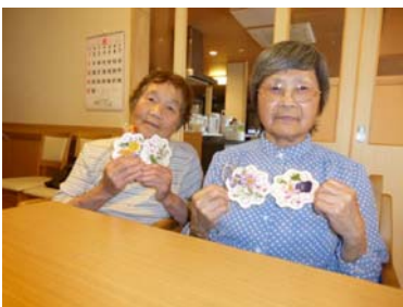
自分で作った作品を持って御満悦 (*^_^*)